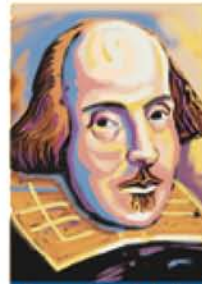
Romeo und Julia