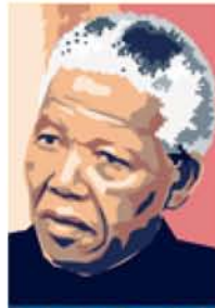
Ende der Apartheid