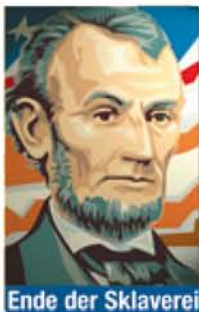
Ende der Sklaverei